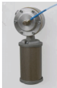
Dekompresioni ventil sa prigušivačem