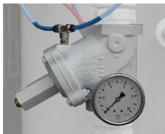
Ventil glavnog vazdušnog voda