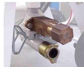
Uređaj za odmeravanje količine abraziva