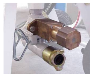
Uređaj za odmeravanje količine abraziva