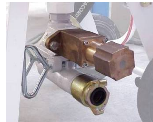
Uređaj za odmeravanje količine abraziva