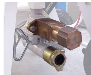
Uređaj za odmeravanje količine abraziva